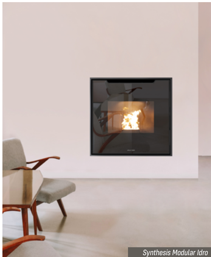
Synthesi Modular Idro