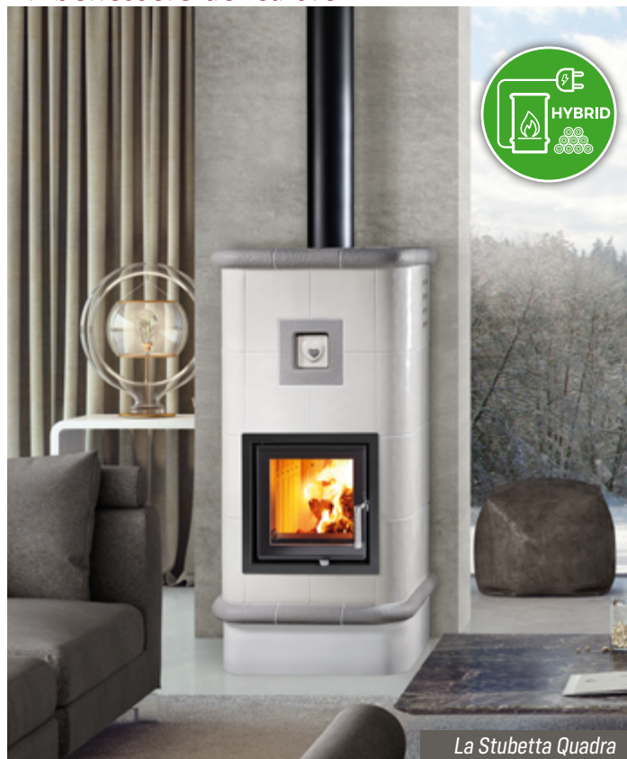
La Stubetta Quadra