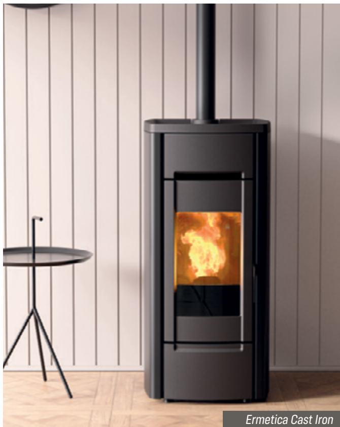
Ermetica Cast Iron